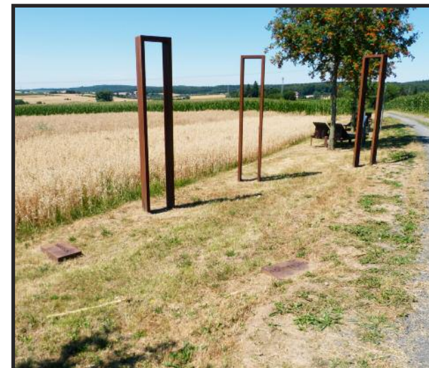
Herrliche Aussicht von der Hohen Straße

1845 wurde durch Orgelbauer Ratzmann aus Gelnhausen eine Orgel eingebaut, die vor einigen Jahren originalgetreu restauriert wurde.